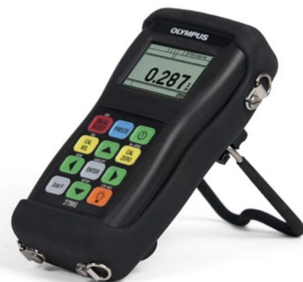
27MG с защитным резиновым чехлом (опция), шейным ремнем и подставкой

По вопросам приобретения дополнительных комплектующих (держатели, зонды, контактные жидкости и т.п.) обращайтесь к региональному представителю Olympus.