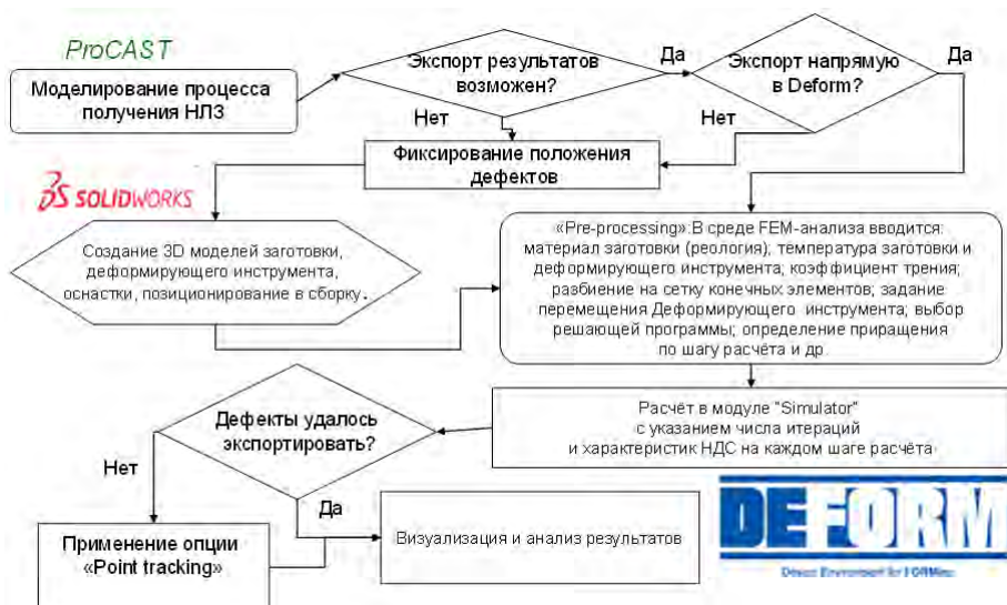
Рис.3 Алгоритм моделирования сквозных технологических процессов

- если экспорт возможен, но не напрямую в Deform, а в программу 3D визуализации типа SolidWorks, то тогда создаваемая модель уже будет учитывать дефекты, и их отслеживание не будет вызывать трудностей;