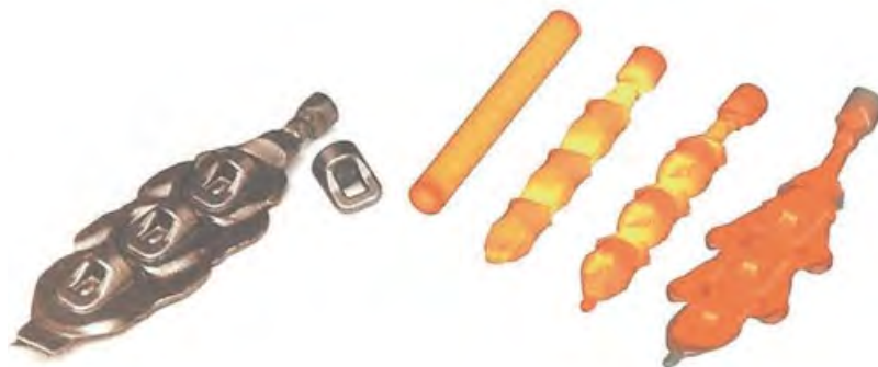
Рис. 3. Благодаря моделированию процесса получения проушины баллона для сжатого воздуха процент брака удалось снизить с 11 до 3%

Моделирование позволило оценить влияние на конечный результат каждого из этих вариантов. В частности, было определено оптимальное количество ударов (с максимальной энергией) молота, необходимых для заполнения полости штампа. Кроме того, в процессе моделирования производилось незначительное варьирование геометрией инструмента, что позволило найти ее оптимальную форму. Также были даны рекомендации по оптимальной температуре нагрева заготовки с учетом времени ее транспортировки от печи к молоту. Таким образом, процент брака при производстве проушины был снижен до 3.