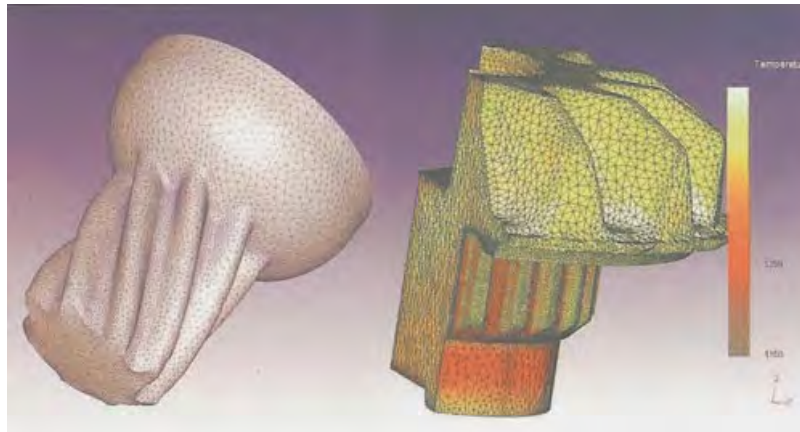
Рис. 2. Моделирование широко применяется при разработке технологических процессов холодного прессования зубчатых колес (слева) либо получения их методами горячей объемной штамповки

Еще десять лет назад косозубое зубчатое колесо получали механообработкой из круглой поковки или из прутка. Сегодня такие поковки можно получать путем холодного прессования или горячей объемной штамповки с зубьями, близкими по форме к окончательному виду. При разработке технологического процесса получения такого типа поволок методами ОМД широко применяется компьютерное моделирование в DEFORM 3D (рис. 2).