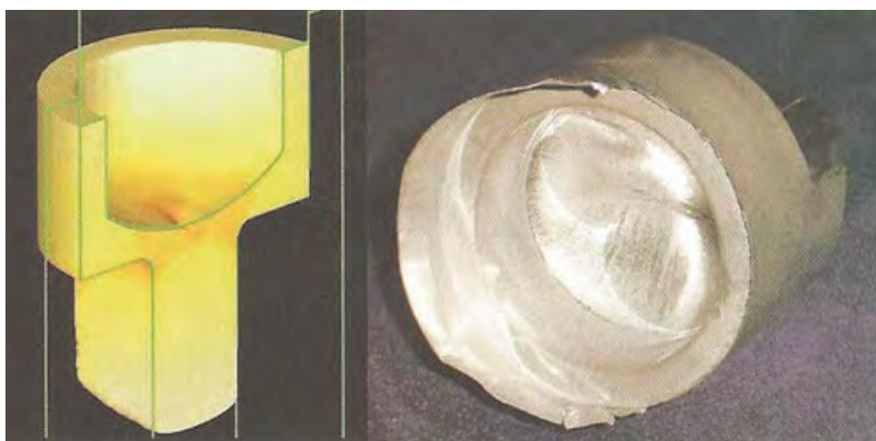
Рис. 1. Прессование детали из алюминия моделировалось в программном комплексе DEFORM 3D