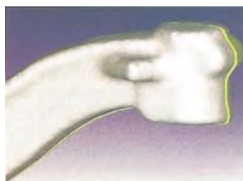
Рис. 4. Кованая балка моста до термообработки (белым) и после (желтым)

Моделирование позволило оценить влияние на конечный результат каждого из этих вариантов. В частности, было определено оптимальное количество ударов (с максимальной энергией) молота, необходимых для заполнения полости штампа. Кроме того, в процессе моделирования производилось незначительное варьирование геометрией инструмента, что позволило найти ее оптимальную форму. Также были даны рекомендации по оптимальной температуре нагрева заготовки с учетом времени ее транспортировки от печи к молоту. Таким образом, процент брака при производстве проушины был снижен до 3.