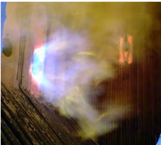
Рис.1 Фотография факела старой горелки в топке котла

Результат работы: разработанная горелка нового типа установлена на ряде ТЭЦ АО МОСЭНЕРГО.