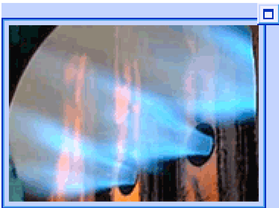
Рис.3 Фотография общего вида факела новой горелки в топке котла.

Фотографии факела новой горелки при работе в двух режимах. Изолинии температуры и векторы скоростей течения газа, полученные во FlowVision, наложены на экспериментальные фотографии.